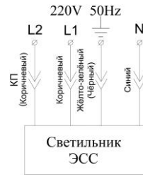
Светильник с аварийным режимом L1- основное питание L2 -контроль присутствия U (подключать от эл. сети 220В фаза)